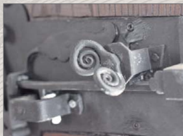
Detail historického dveřního zámku

Kostel sv. Kateřiny stojí na vyvýšeném břehu říčky Sedlnice při cestě ze Štamberka do Nového Jičina. Samotný kostel je vrcholně gotická stavba z přelomu 14. až 15. století s pravouhlým kněžištěm a obdélnou lodí. Do ní se vchází z venkovní podsíně pravouhlým kamenným portálem v ose kostela. K jižní straně lodi přiléhá později přistavěná zděná předsíň se sedlovou střechou a bedněným štítem s kabřincem. Kostelní loď odděluje od kněžiště lomený vítězný oblouk s kamenným ostěním. V ose kněžiště je původní gotické lomené okno s kružbou. Na evangelní straně se vstupuje pravouhlým gotickým portálem do úzké plochostropé sakristie, v níž se