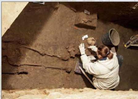
Archeologický výzkum v r. 2012