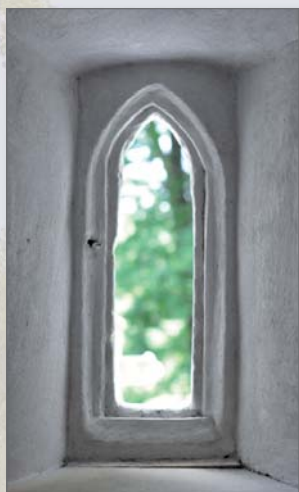
Gotiké okénko v sakristii

dochovalo malé lomené okénko s kamenným ostěním. Nad sakristií je roubená oratoř otevřená do kněžiště dvěma obloukovými arkádami.