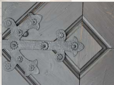
Detail dveřního kování

Koncem 16. století ves zanikla a místo ní dala vrchnost postavit dvůr patřící ke Štamberku. Zdá se, že až v 17. století byl kostel dán do uží-