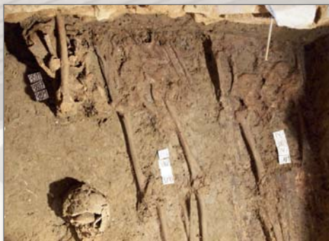
Pohřby pod základy kostela dokládají existenci staršího hřbitova

V roce 2009 byly zkoumány vzorky dřeva z různých míst kostela. Zjistilo se, že krov nad kněžištěm a částí lodi byl vystavěn v letech 1440 až 1441 a představuje nejstarší stojící krovovou konstrukci v Moravskoslezském kraji. Věž nad lodí zbudovali v roce 1557 a dřevěná trojramenná kruchta s vyřezávanou balustrádou je datována léty 1609 až 1610. Není bez zajímavosti, že ve stejné době byla vystavěna nová kruchta i ve štramberském bývalém farním kostele.