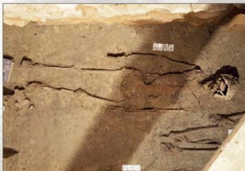
Pohřbená těla pod podlahou kostela

Celkové náklady opravy v letech 2011-2012 dosáhly 4,8 mil. Kč, z nichž 92,5% pokryla dotace Evropské unie. Kostel je nově otevřen od července 2012 a je možné jej navštívit po předěšlé rezervaci na webových stránkách www.svata-katerina.cz .